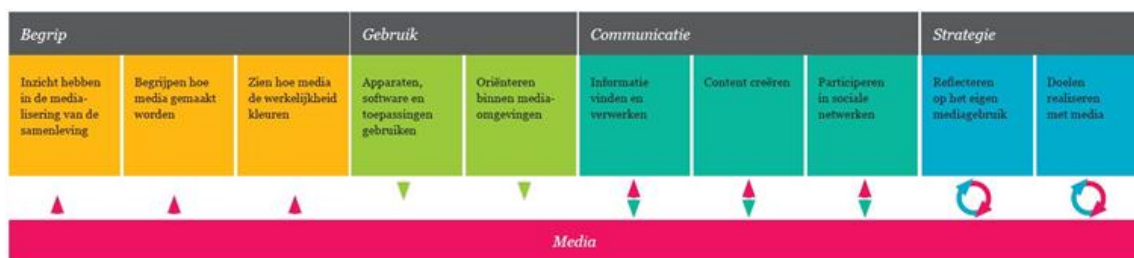
Figuur 1 – Competentiemodel voor mediawijsheid

Om te achterhalen welke competenties worden behandeld in bestaande lesmethodes, zijn 26 methodes geanalyseerd die, in meer of mindere mate, aspecten van mediawijsheid behandelen.