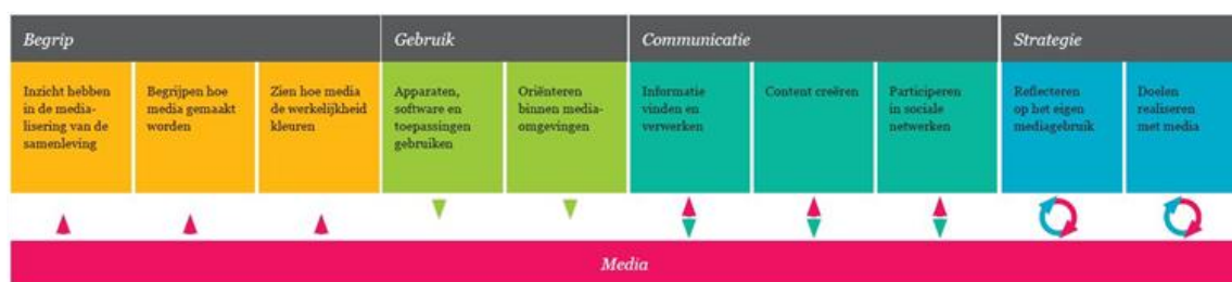
Figuur 1 – Competentiemodel voor mediawijsheid

Om te achterhalen welke competenties worden behandeld in bestaande lesmethodes, zijn 26 methodes geanalyseerd die, in meer of mindere mate, aspecten van mediawijsheid behandelen.